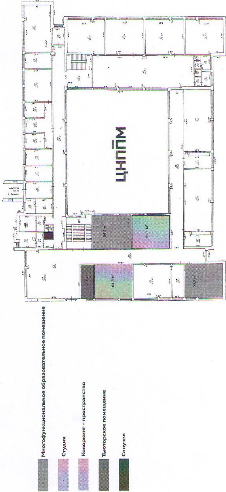
Рисунок 1. Схема расположения помещений ЦНПМПР на 2 этаже корпуса государственного бюджетного профессионального образовательного учреждения «Педагогический колледж им. Н.К. Калугина» г. Оренбурга (ул. Волгоградская, 1)